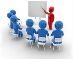
EXHIBIT 9-4 Corporate Programs to Develop Global Managers